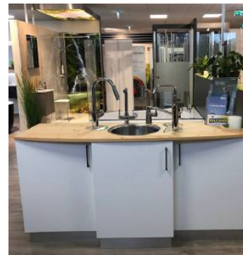
Im Schauraum in Purgstall kann man sich inspirieren lassen.

duktsortiment holen, sondern auch gleich seine persönliche „Wellness-Oase“ planen, gestalten und zu Hause einbauen lassen.