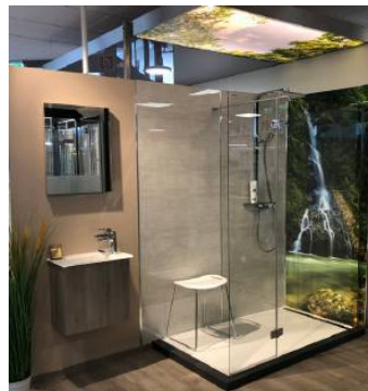
Auf dem Weg zum Traumbad ist man bei Haustechnik Bruckner.

In dieser Ausgabe stellen wir Ihnen den Bereich Badplanung und Badsanierung von Haustechnik Bruckner vor. Im neu gestalteten Schauraum kann man sich nicht nur einen überzeugenden Eindruck vom umfangreichen Pro-